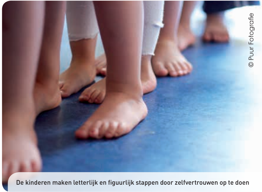
De kinderen maken letterlijk en figuurlijk stappen door zelfvertrouwen op te doen

Tijdens ieder thema werken we aan de ontwikkeling van zowel de grove als de fijne motoriek. We bewegen snel en dan weer langzaam. Zo werken we aan het uithoudingsvermogen, maar zo zorgen