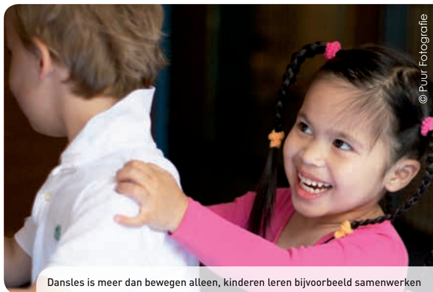
Dansles is meer dan bewegen alleen, kinderen leren bijvoorbeeld samenwerken

Maar de dansles is meer dan bewegen alleen. We leren de kinderen tijdens het dansen om met elkaar samen te werken en om elkaar te helpen. Als we in de kring allemaal op een been staan,